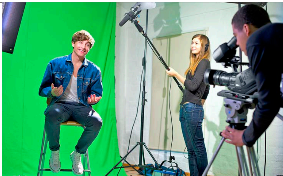
Des ateliers cinéma en anglais.

De nombreux organismes ont créé des formules pour ceux qui s'attèlent au design ou qui aiment la mode et le cinéma. Pour les 9/17 ans, Vivalangues a mis en place une formule « TV Academy » dans la région de Windsor avec 15H de cours d'anglais par semaine et des ateliers dédiés à l'univers