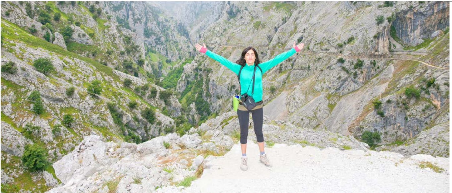
Le grand air des Asturies.